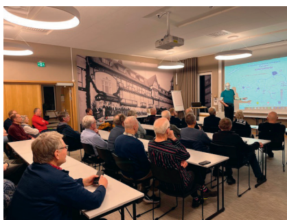
Föredrag var en av programpunkterna vid Veteranträffen på Lassalyckan.